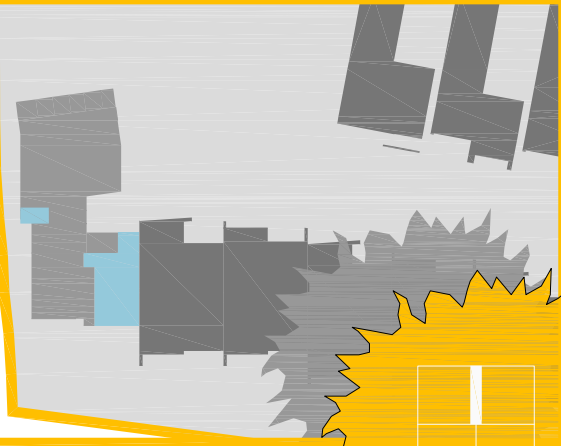
SCHÉMA 1. NP